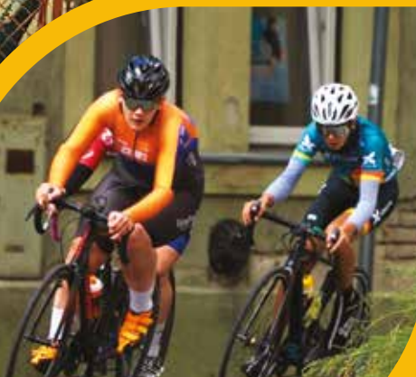
KÜLFÖLDRE SZERZŐDÖTT A GYÖMRŐI KERÉKPÁROS