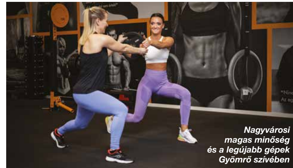
Nagyvárosi magas minőség és a legújabb gépek Gyömrő szívében

Az ember olyan helyre szeret rendszeresen járni, ahol jól érzi magát. Ehhez nagyban hozzájárul a barátságos légkör, a kifogástalan tisztaság és a támogató közösség is. Fontos, hogy fizikailag is jól érezd magad edzés közben, így a megfelelő hőmérséklet elengedhetetlen. A fűtésnek és a légkondinak köszönhetően mindig kellemes a klíma: bent nem esik az eső, nem fúj a szél, nem kell a hőségtől sem tartanod, így télen-nyáron időjárástól függetlenül tudsz sportolni.