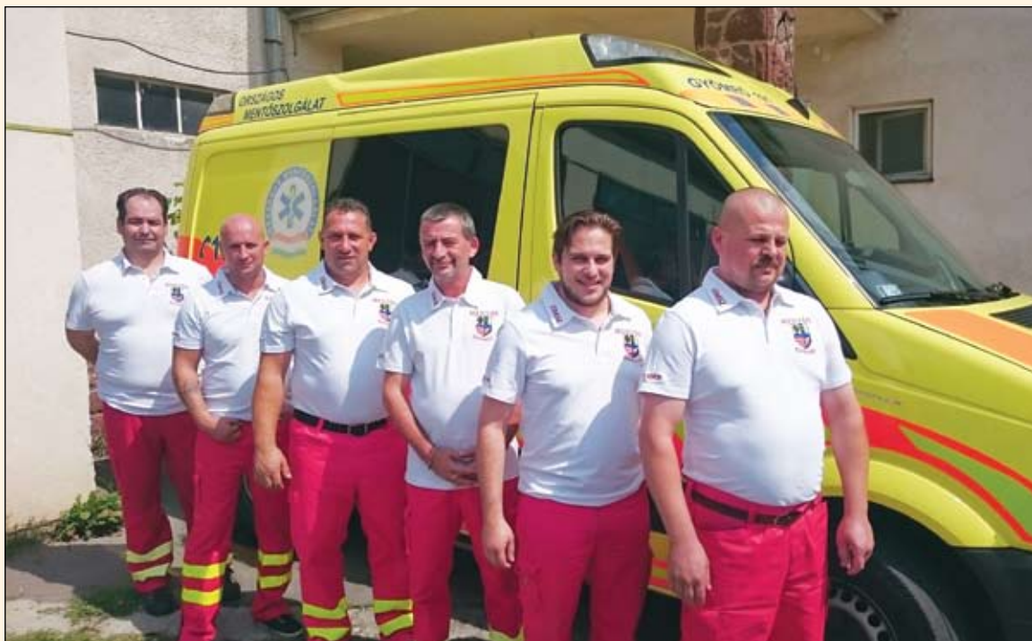
Akik éjjel-nappal értünk dolgoznak