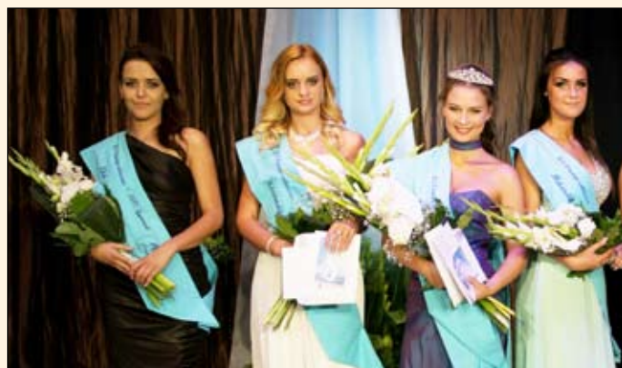
A Tó szépe verseny kiválasztottai