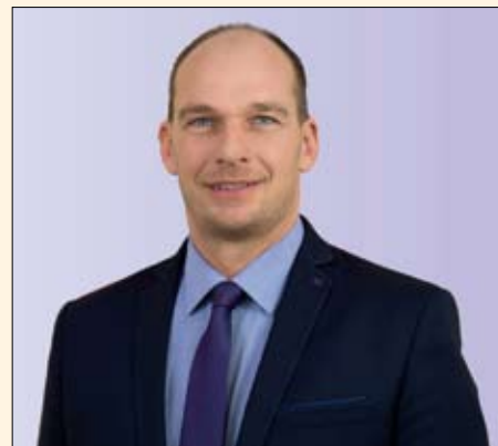
Mezey Attila, polgármester

Jól tervezetten, megfontoltan, erre kell most koncentrálni, ez kell legyen a városi fejlesztések fő iránya. Azt tapasztalom ugyanis, hogy városunk hirtelen túlnőtte magát. Ez megmutatkozik a közmű kapacitás igényekben, az oktatási intézményekben, a bölcsődei, óvodai férőhelyekben, de még az olyan