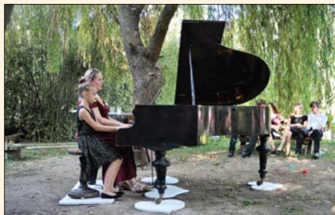
Gyömrői tehetségek koncertje a Katalin kúriában