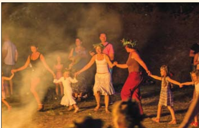
Tűz körüli örömtánc

A fesztivál kiemelt programja volt az idei évben Szent Iván éjjeléhez kapcsolódva William Shakespeare Szentivánéji álom című színdarabja, amelyet a Teleki Kastély kertjében épített szabadtéri színpadon a Thália Tanoda színészeinek közreműködésével láthatott a közönség. Az impozáns helyszín már a tavalyi Edwin Marton koncert során is megkapó látványt nyújtott.