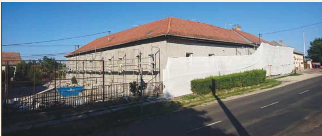
Készül a II. Rákóczi Ferenc iskola új homlokzata

pénzügyi lehetőségeit is kihasználjuk ahhoz, hogy bővítsük az intézményeket. Új csoporttal bővül szeptemberre a Bóbita Óvoda, valamint a Bölcsőde egy csoporttal való bővítését is megkezdjük. Jó néhány intézményben zajlik még a nyár folyamán felújítási beruházás, melyekről néhány képet ezen cikkhez is mellékelek. Már most látható, hogy jövőre kevés lesz a jelenlegi óvodai férőhely, ezért már az év elején megkezdjük a jelenleg használaton kívüli Deák utcai iskolaépület átalakítását óvodává. Ebben az intézményben lehetőség van az átalakítások után egy