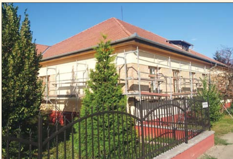
Kezdődik a Csokonai sulifelújítása

Szóval a rengeteg más teendő mellett a közmű oldalon is van feladat bőven. Sajnos az egyik legkaotikusabb terület a szemétszállítás rendszere, ami a közelmúltban elvégzett államosítás következtében kikerült önkormányzatunk hatásköréből. Ezt a változást röviden úgy foglalhatnám össze, hogy az eddig jól bevált, jól működő szállítási rendszert felváltotta a káosz. Ebben most nem is szeretnék elmélyülni, de arról biztosíthatom városunk minden kedves lakosát, hogy mindent meg fogok tenni annak érdekében, hogy valami normális rendszer alakulhasson ki a szemétszállítás területén. Teendő és feladat tehát van bőven. Ezekre a területekre pedig a magam részéről soha nem problémaként tekintek, hanem kihívásként, olyan feladatként, amelyeket szeretném, ha jól teljesítenénk. Örölnék, ha mindig arról számolhatnák be önöknek, hogy városunk egyre inkább utoléri magát a lakossági szolgáltatásokkal. Városunk lakossága pedig azt érezné, hogy kellemes és élhető környezet és kifogástalan intézmény hálózat szolgálja az itt élőket.