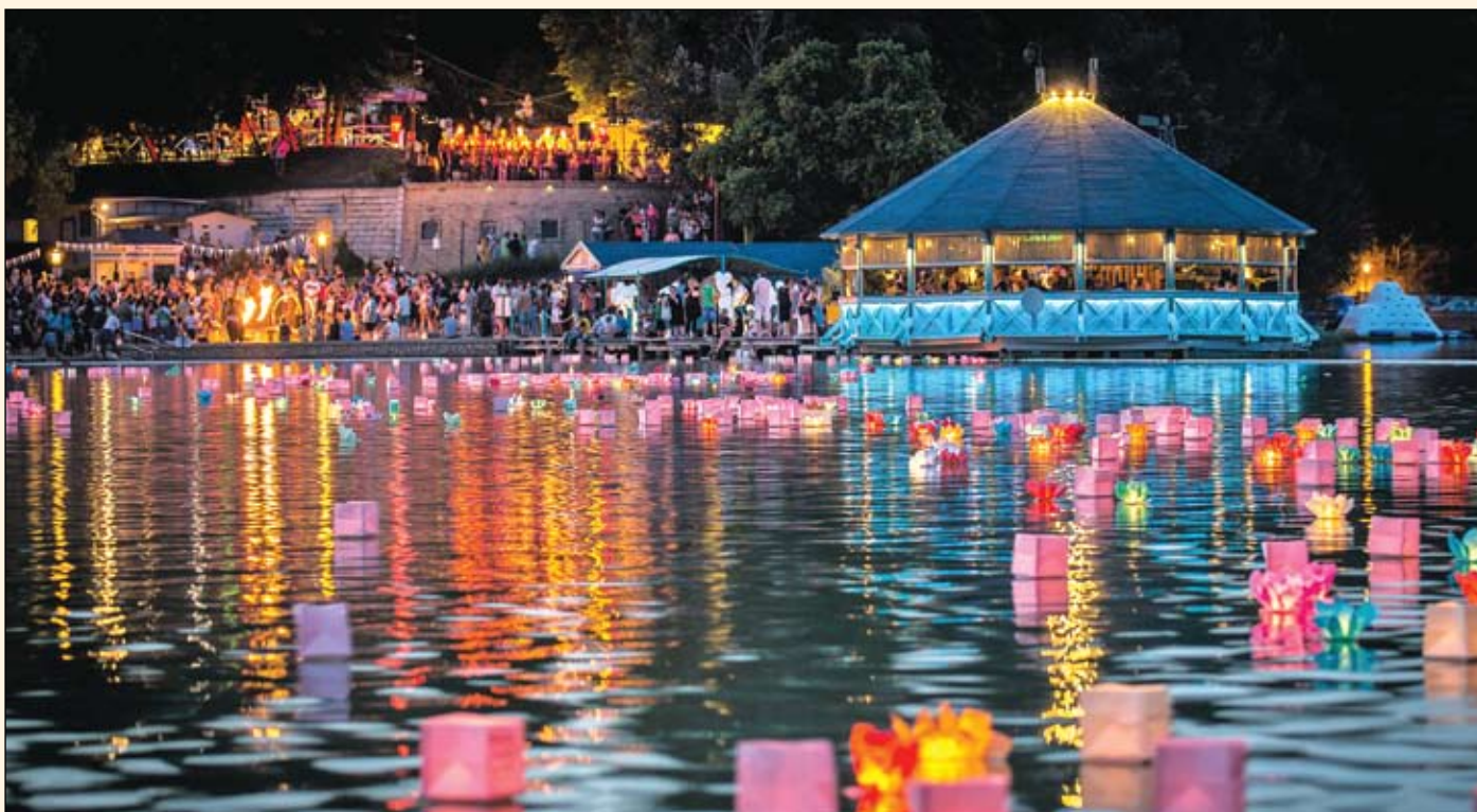
A kívánság lámpások úsztatása