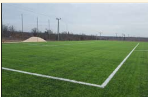
Folytatódik a sportközpont építése – 6. oldal