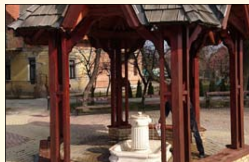
Megújult az Artézi kút – 6. oldal