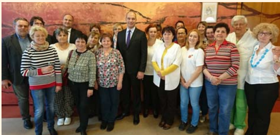
A rendelőintézet dolgozói

álltak ki az egészségház megmaradásáért. Köszönöm a Bajcsy kórház vezetésének, hogy példaeértékűen partnerek voltak kezdeményezésünk elfogadásában. Valamint hálás vagyok a környező települések polgármestereinek, hogy összefogtak velünk a lakosság ellátásának biztosítása érdekében.