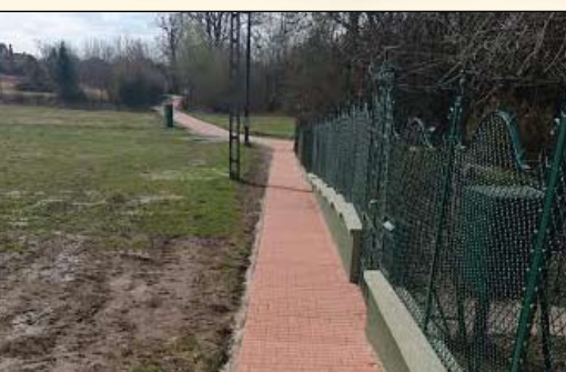
Megépült a Tőzeges tóhoz vezető sétány – 5. oldal

Aláírták a rendelőintézet jövőjét garantáló megállapodást! – 3. oldal