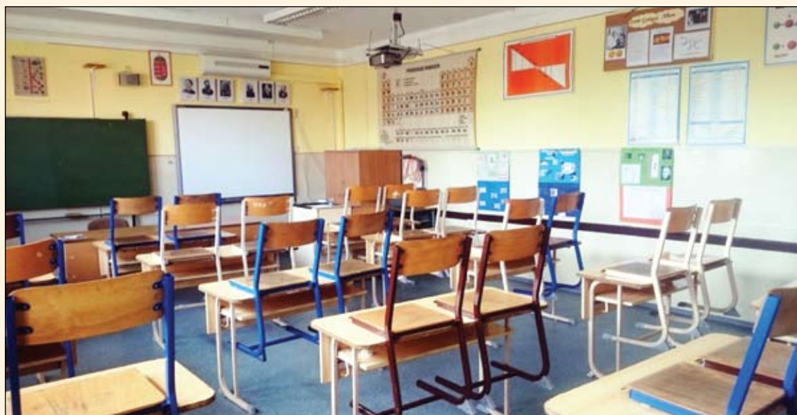
A Fekete István Általános Iskola tanterme a felújítás után

felül vállalkoztunk, jó néhány intézményben jelentősebb munkák elvégzésére. Vegyük hát sorra, mely intézményekben tudtunk nagyobb felújításokat végezni az idén! Az egyik ilyen a Fekete István Általános Iskolában készült el, ahol négy tantermet újítottunk fel teljesen (a festéstől a burkolatcseréig). Idén a leginkább felújításra szoruló felső tagozatos termekkel kezdtük, jövőre pedig az alsó tagozat tantermeire fogunk koncentrálni. Nem túrt halasz-