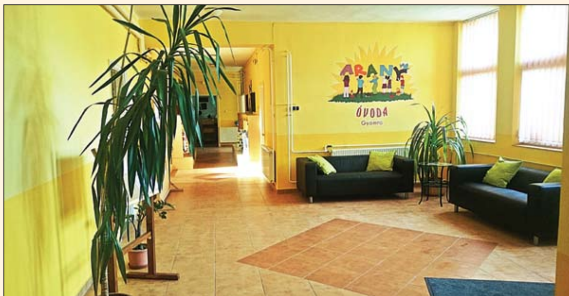
Az Arany Óvoda aulája