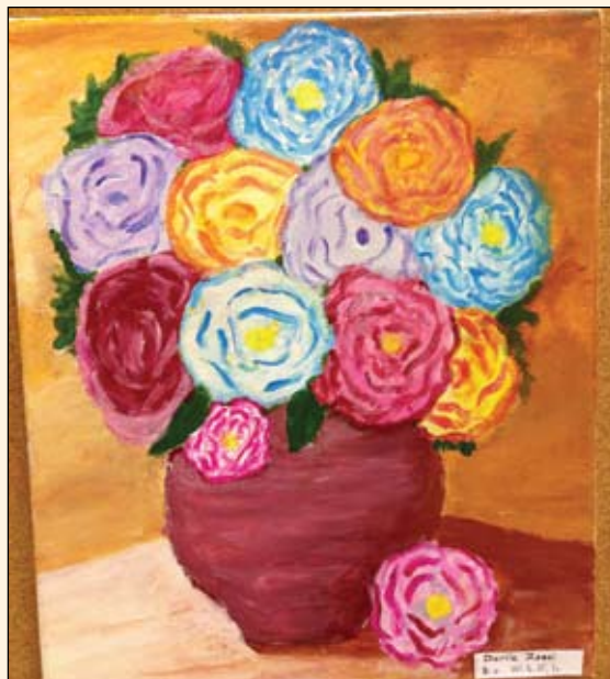
Plakátra kerül - Daróc Zseni rajza

Az elkészült műveket később megtekintette Gyenes Levente polgármester, valamint a városi rendezvényekért felelős csapat is. Hosszas értékelés után végül a Weöres Sándor Általános Iskola