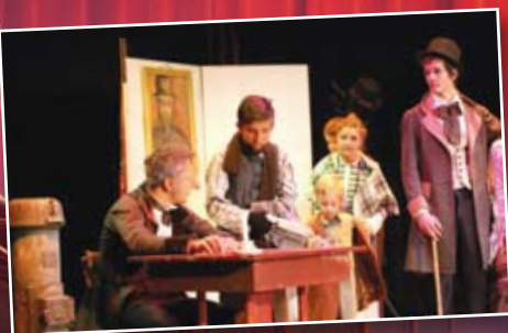
Karácsonyi ének a Csetetekert Gyermekszínház előadásában