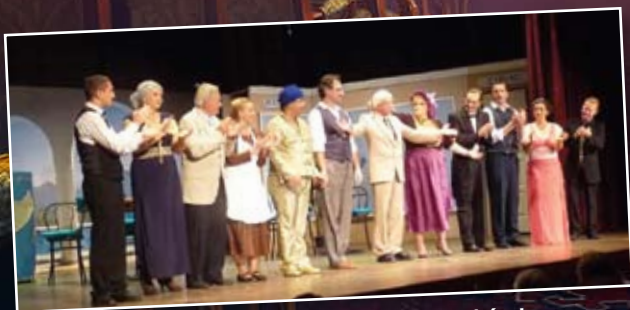
Az édes teher című 3 felvonásos bohózat a GyömrőSzínház előadásában