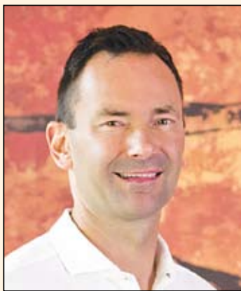
Gyenes Levente, polgármester