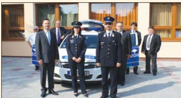
Jobbszélien a távozó kapitány