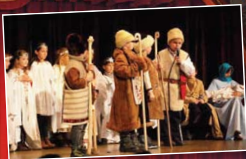
A gyömrői gyerekek betlehemes műsora