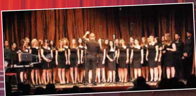
A pécsi Babits Kórus koncertje