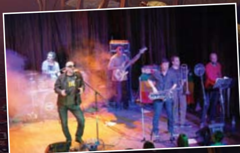
Reggae Előszilveszter – Ladánybene 27 koncert