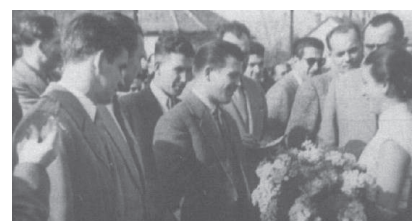
Puskás Ferencet fogadják a gyömrőiek 1954-ben (Forrás: Gellér Nándor-Szabó József: A Gyömrői Sport Egyesület története c. könyv)

El kell ismerni, hogy az Aranycsapat szempontjából hétvégi örömfocinak is beillett a több ezer érdeklődő előtt játszott mérkőzés. A korabeli lapok szerint Kocsis és Hidegkuti triplázott, s mellettük többek között Puskás Öcsi is megörögette a Spartacus hálóját. Bár a végeredmény 12:1 lett, ennek ellené-