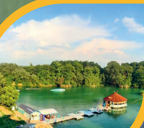
Megújul a Tófürdő