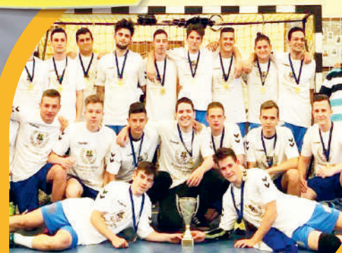
Bajnok lett az ifi férfi kézilabda csapat

Indul a Szeretem a városom! Gyömrő mozgalom