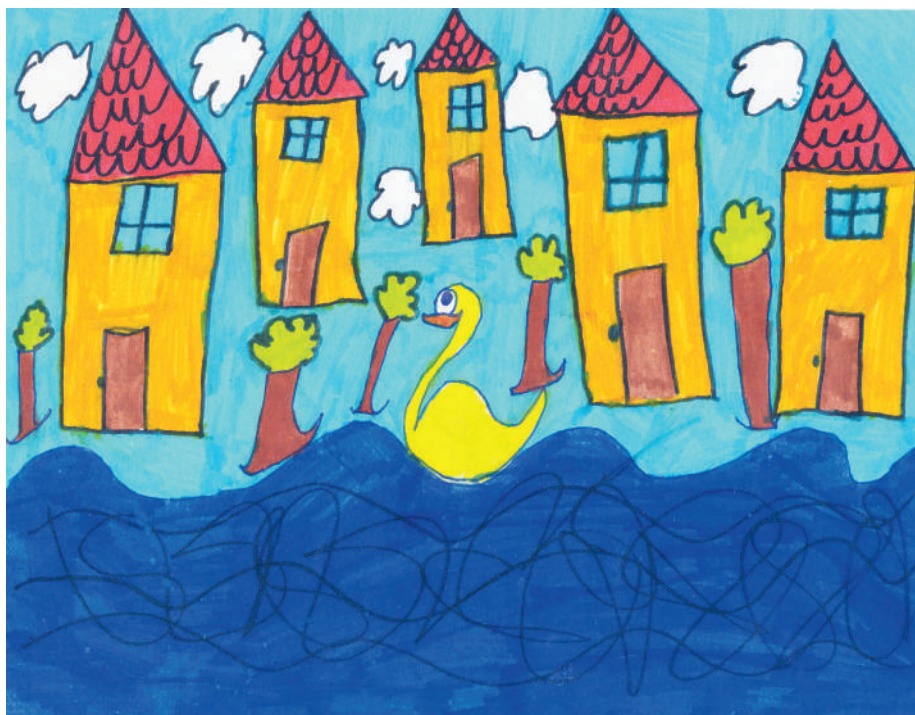
Illusztráció: Németh Krisztina

(A Városi Könyvtár és a Gyömrői Olvasónapló közös szervezésében kiírt „Én mesém” pályázat szülő és gyermek kategóriájának első helyezett meséje)