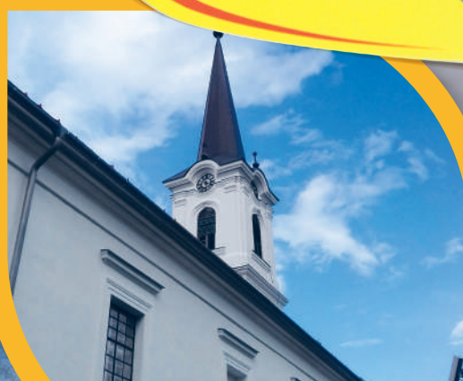
Református óvoda nyílnak városunkban