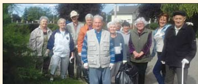
Harmónia Idősek Otthona