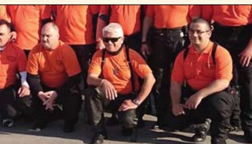
Bemutakozik legújabb alpolgármesterünk - 4. oldal