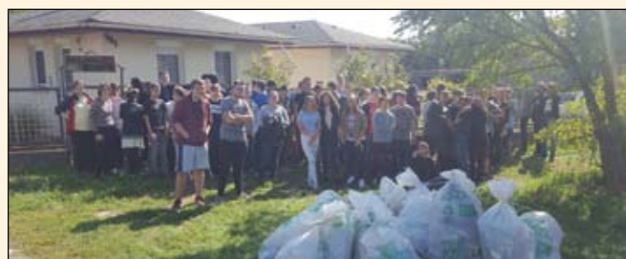
A Teleki gimisek