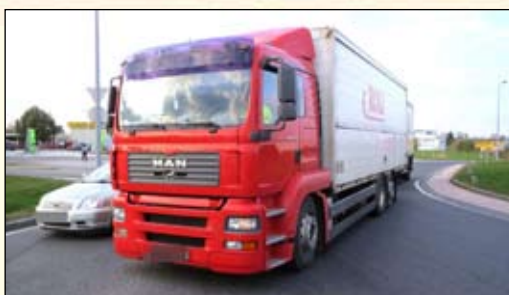
Fél áron hajthatnak be a közutakra a helyi vállalkozók - 6. oldal