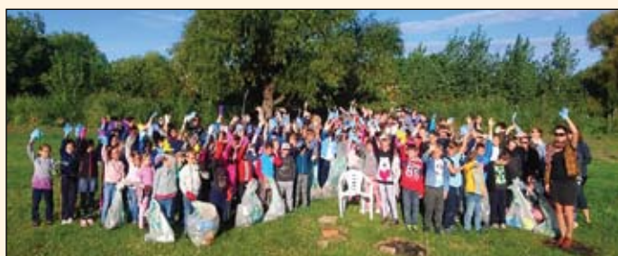
A II. Rákóczi Ferenc Általános Iskola csapata