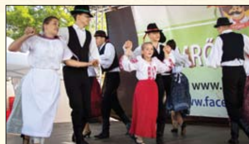
Véget értek a nyári rendezvények - 9. oldal