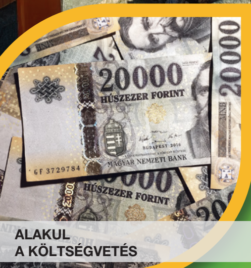
ALAKUL A KÖLTSÉGVETÉS