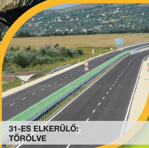
31-ES ELKERÜLŐ: TÖRÖLVE