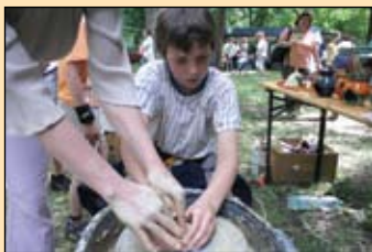
A népi kézműves foglalkozások sem maradhattak ki a programból