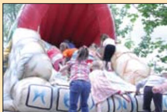
Mindig telt ház volt az ingyenes ugrálóvárban