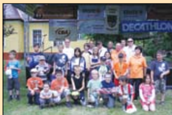
Gyermek horgászverseny résztvevői és szervezői