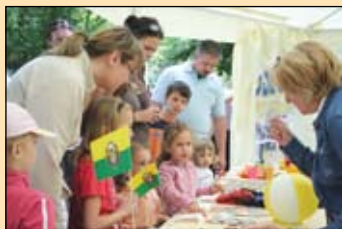
A Gyömrő 2000 Kör ajándéksátra