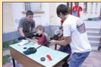
A nagyobbcskák légguskával is kipróbálhatták ügyességüket

Köszönjük a támogatást és a részvételt: Városi Önkormányzat, Gyömrő 2000 Kör, Jó Hátszelet Alapítvány, Petőfi Sándor Művelődési Ház, Gyömrő Színház, Gyömrő TV (SIGNAL TV), Családsegítő és Gyermekjóléti Szolgálat, Monori Polgárvédelem, Gyömrő SE, K.I.Gy.E., Kulturiszt, Polgárőrség Tűzoltó egysége, Rendőrség, Árvácska Állatvédő Egyesület, Fincsi Tej Kft., Kétkalkéz Hobby bolt, Mikka-Makka Játsszoház, Gyermekmentő Alapítvány, Weöres Sándor Ált. és Műv. Iskola, Fekete István Ált. Iskola, II. Rákóczi F. Ált. Iskola, Mesevár óvoda, Bóbita óvoda, Brand-Sec Kft, Gyarmati Tanoda és még sok kedves, önzetlen segítőnknek.