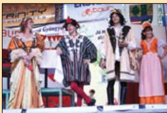
Itt járt Mátyás király – mesejáték a Gyömrő Színház előadásában