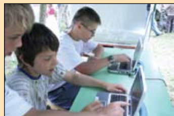
KIT-es tudásportál bemutatása