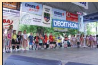
Az óriási színpadot teljesen megtöltötték a kis ovisok